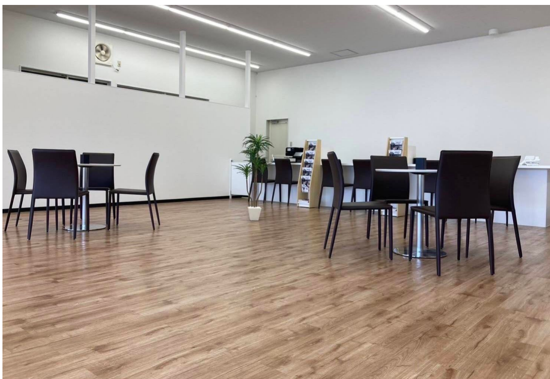
オトロン岐阜店（内観）